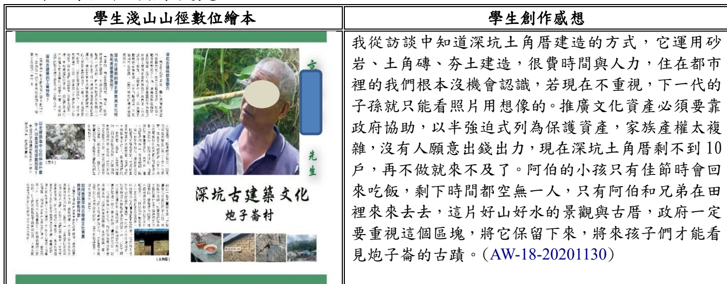
表 5 學生作品與創作感想