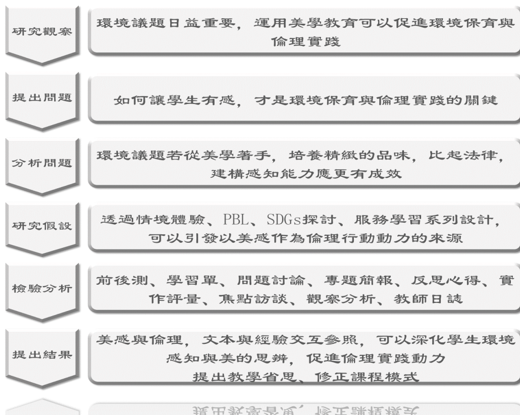
圖 3 研究架構圖